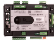
ComAp IntelliGen BaseBox